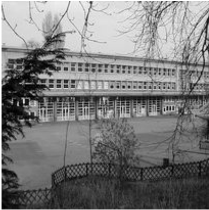
La cour du Lycée, années 50