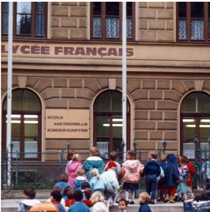
Entrée de Grinzing, 1988