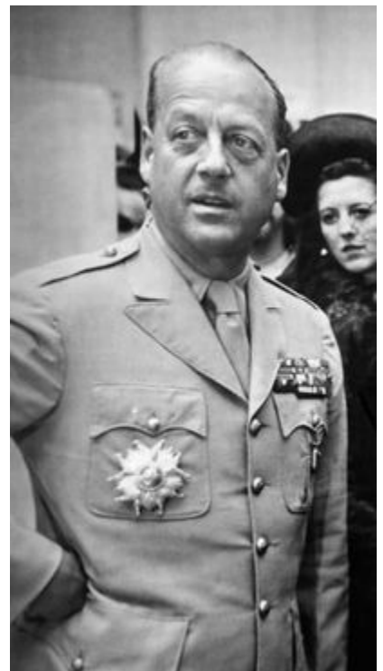
Le général Béthouard