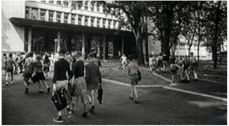
Entrée du Lycée en 1957