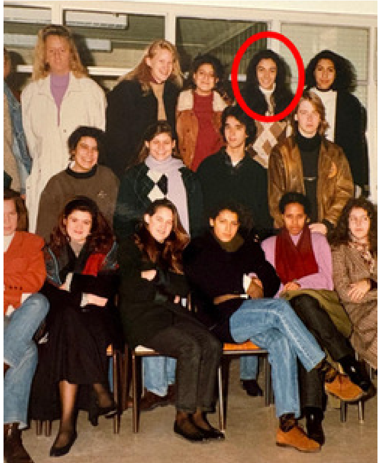
Caption - Um as elest, que vel iduciisti aut utem. Et dolendu cipsum quam laut am.

Avant de venir à Vienne, elle a fréquenté le Lycée Français de Téhéran. La décision de ses parents de l'inscrire au Lycée Français de Vienne s'explique par le fait que l'établissement était déjà laïc à cette époque et qu'il n'y avait pas d'influence religieuse dans l'enseignement. La maîtrise de la langue française constitue bien sûr un atout et offre de nombreux avantages pour la poursuite des études après le baccalauréat, notamment pour pouvoir intégrer d'excellentes universités françaises.