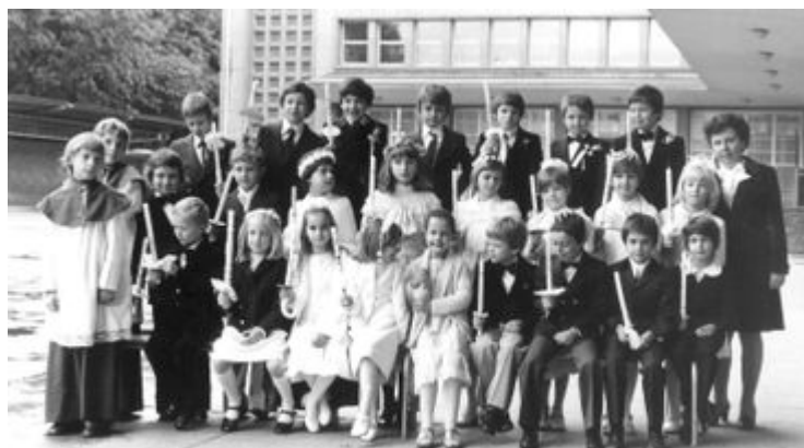
Erstkommunion en 1977