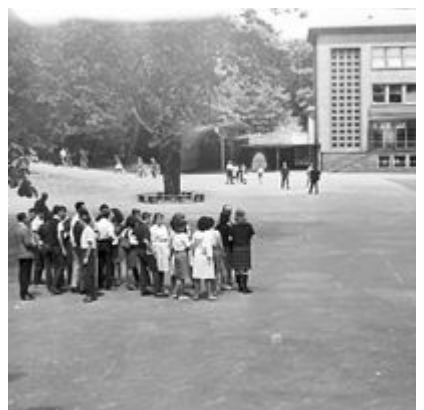
Cour d'école en 1964